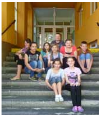
Členovia redakčnej rady