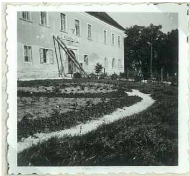
Budova Meštianskej školy v kaštieli podpretá drevenými trámami