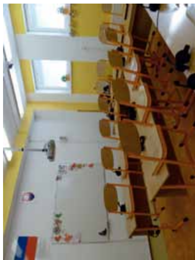
Učebňa anglického jazyka