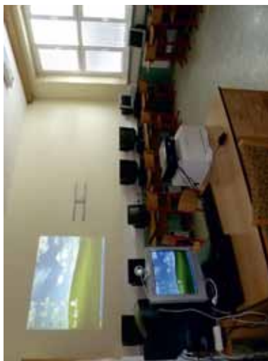
Počítačová učebňa v hlavnej budove