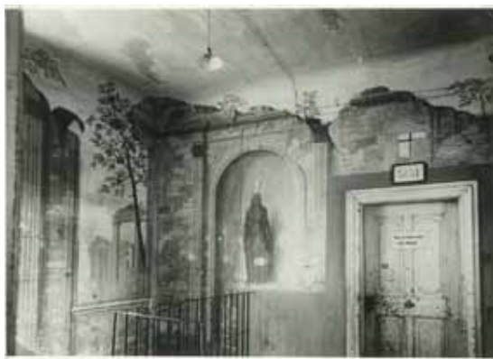
Interiér kaštieľa so zachovanými maľbami

Kaštieľ nebol po vojne zničený, ale budova nevyhovovala podmienkam vzdelávania a už od začiatku sa v myšliach na škole pôsobiacich riaditeľov a učiteľov črtal plán novej školy. Časom však boli nevyhnutné niektoré opravy. V roku 1924 sa pre chlapčenské záchody vybudovala betónová žumpa a pod najväčšiu triedu bol vsunutý betónový nosič. V ďalšom roku sa opravila časť plotu okolo školskej záhrady a mesto dalo opraviť školskú pumpu.