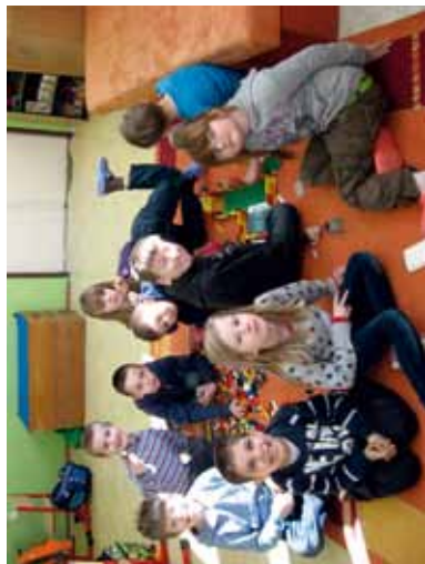
Prváci počas voľnej hry