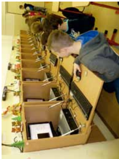
Počítačová učebňa v budove prístavby