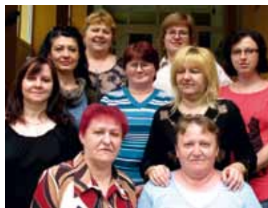
Zamestnankyne školskej kuchyne