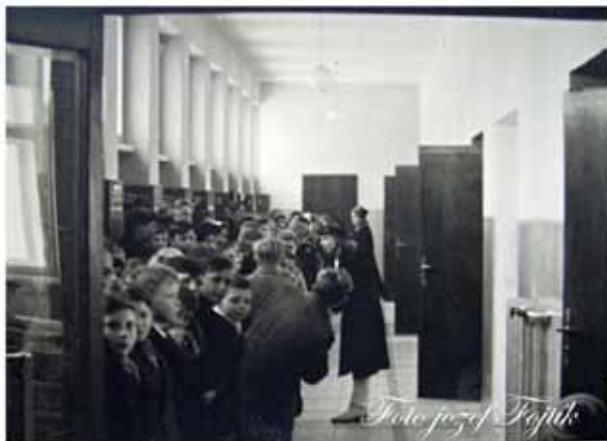
Otvorenie školy 15. 2. 1942 – chodba na prízemí

Po týchto slávnostných udalostiach čakali školu ťažké časy. Za zmienku stoja najmä vojnové roky 1944 a 1945, počas ktorých sa v škole vystriedali partizáni z Trenčianskych Teplíc, ktorých neskôr vytlačilo z mesta nemecké vojsko. To obsadilo školu a neskôr ju zase obsadili partizáni zo Slatiny nad Bebravou a z Inovca. Nemeckí letci a silnejšia nemecká pechota však na dlhší čas školu opäť obsadili. Preto riaditeľstvo školy vyzvalo žiactvo, aby sa pripravovalo na skúšky doma. Tie prebehli začiatkom roka 1945.