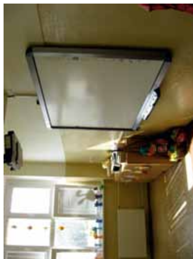
Jedna z tried s interaktívnou tabuľou