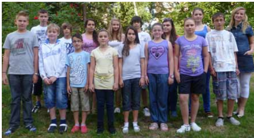
Členovia školského parlamentu

Žiacky parlament sa snaží riešiť otázky, ktoré sa týkajú nás všetkých, aby sme sa cítili na našej škole ešte lepšie.