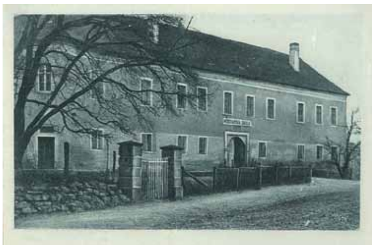
Meštianska škola v kaštieli rodiny Thurzo-Illesházy