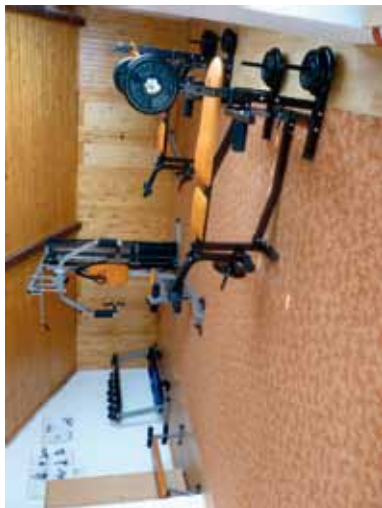
Učebne telesnej výchovy (miestnosť na hranie ping-pongu a posilňovňa)