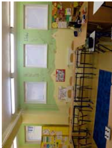
Učebňa nemeckého jazyka