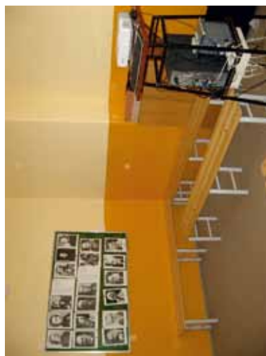
Učebňa hudobnej výchovy