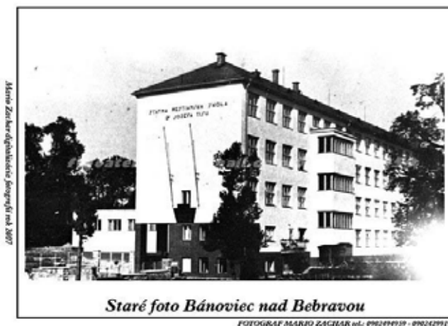
Nová budova meštianskej školy s nápisom Štátna meštianska škola Dr. Jozefa Tisu