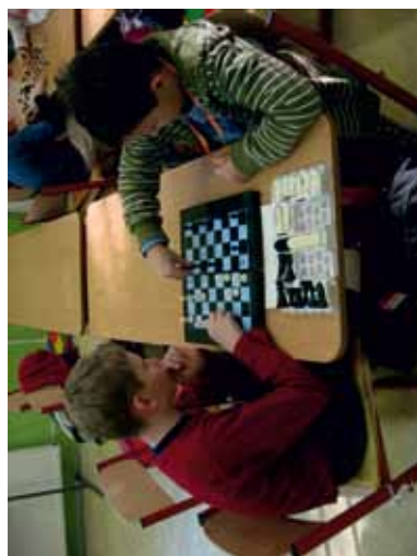
Turnaj žiakov v šachu a v dáme