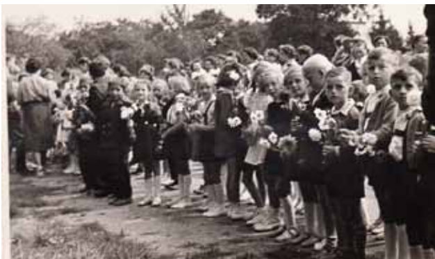
Privítanie prvákov na školskom dvore v šk. roku 1958 – 1959