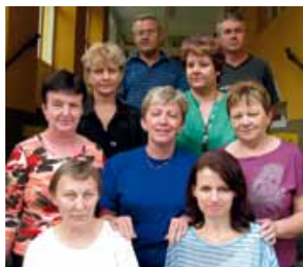
Technicko-hospodárski a administratívni zamestnanci