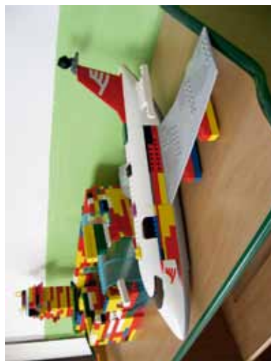
Výstava prác vytvorených z lega