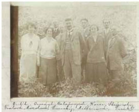
Jedni z prvých učiteľov pôsobiacich v meštianskej škole

Učitelia sa starali nielen o rozumový, ale i o duševný rozvoj detí. Nacvičovali s nimi divadelné hry, bábkové predstavenia i piesne, ktoré potom prezentovali pri rôznych oslavách rôznych výročí alebo osobností. No i napriek týmto snahám sa učitelia často stretávali s neporozumením občanov mesta. Podľa školskej kroniky vznikali konflikty nielen medzi občanmi a učiteľmi, ale i medzi učiteľmi a katolíckym duchovenstvom v meste.