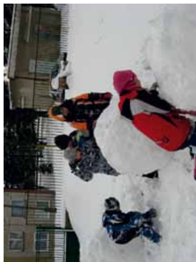
Zima na Duklianskej