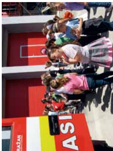
Návšteva u hasičov